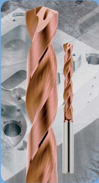
VHM Bohrer IK Dm. 6,0 Material: 1.7227, 1200 N/mm 2 3xD, Sackloch V c : 100 m/min V f : 0,15 mm/U